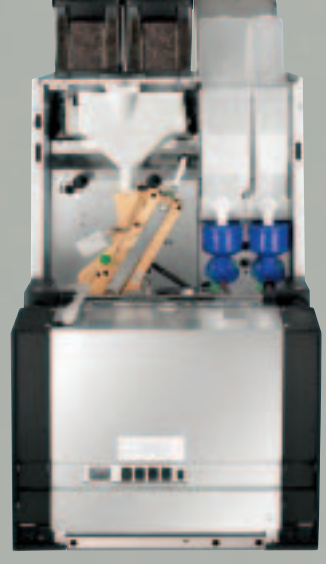
Exemple de Version Espresso (indicative)